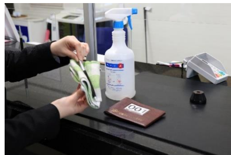
ロッカーホルダー、筆記用具の消毒