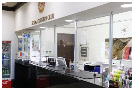
飛沫防止用アクリル板